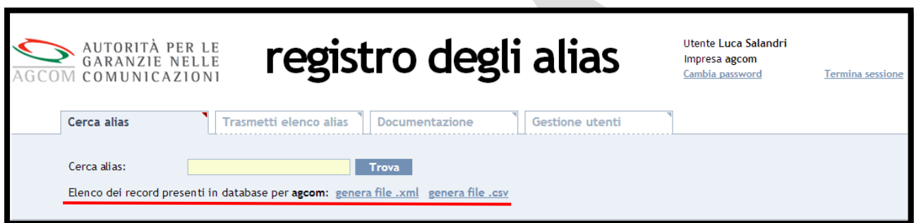
Figura 6 – richiesta della lista globale dei propri record immessi nel sistema Alias .

Il soggetto richiedente deve soltanto selezionare il formato con cui vuole ricevere il predetto elenco e specificatamente ".csv" oppure ".xml".