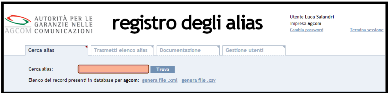
Figura 7 – richiesta delle informazioni relative ad un singolo Alias .

Si noti che tutti i record relativi ad un Alias dato in uso da un singolo fornitore di servizi di messaggistica aziendale ad un singolo cliente aziendale sono raggruppati tra di loro fornendo tutte le date di attivazione e di cessazione.