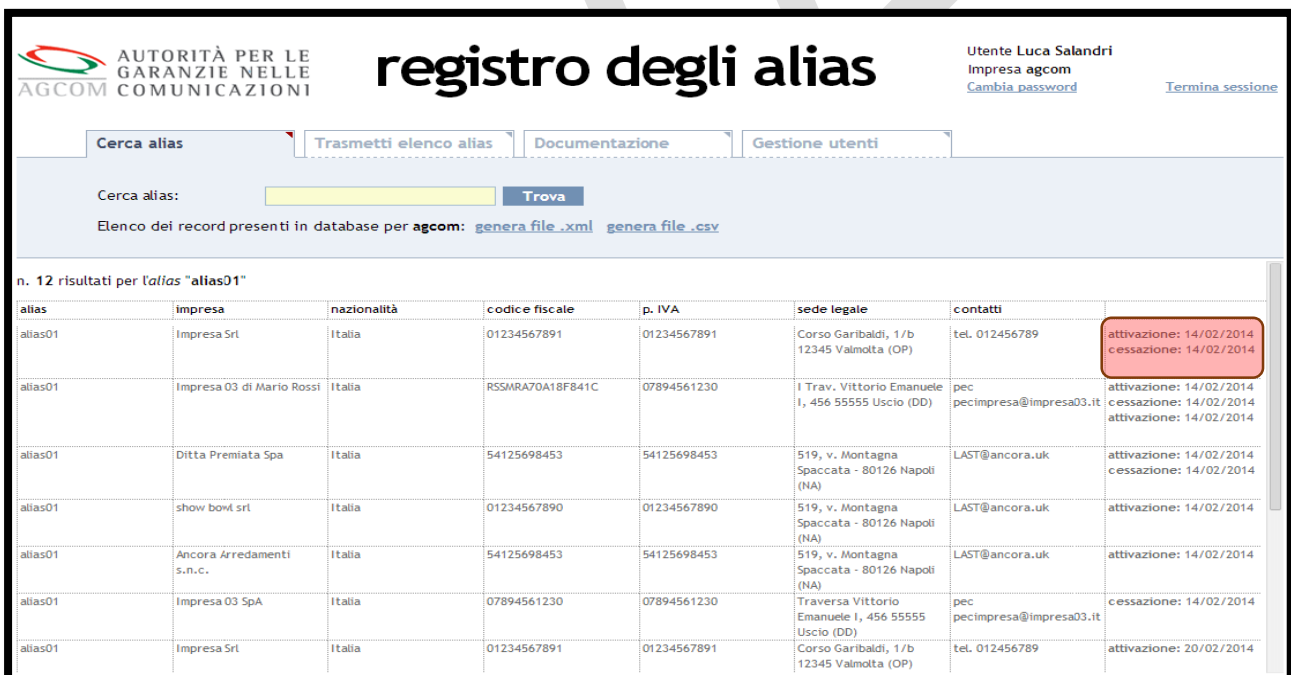
Figura 8 – risposta alla richiesta delle informazioni relative ad un singolo Alias .

A tali campi ne viene aggiunto un ulteriore contenente, in un'unica area, le informazioni relative alle attivazioni e cancellazioni con i relativi <time stamp>.