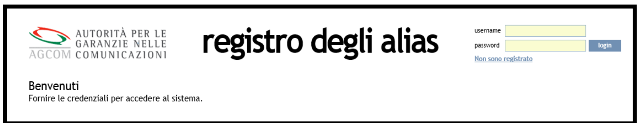
Figura 1 – home page del sistema Alias .

Il singolo soggetto autorizzato ex art. 25 del Codice delle comunicazioni elettroniche come “fornitore di servizi di messaggistica aziendale” o “fornitore di servizi di comunicazione elettronica”, per effettuare la registrazione deve accedere alla home page del sistema Alias ( https://www.alias.agcom.it ) e utilizzare il link “Non sono registrato”.