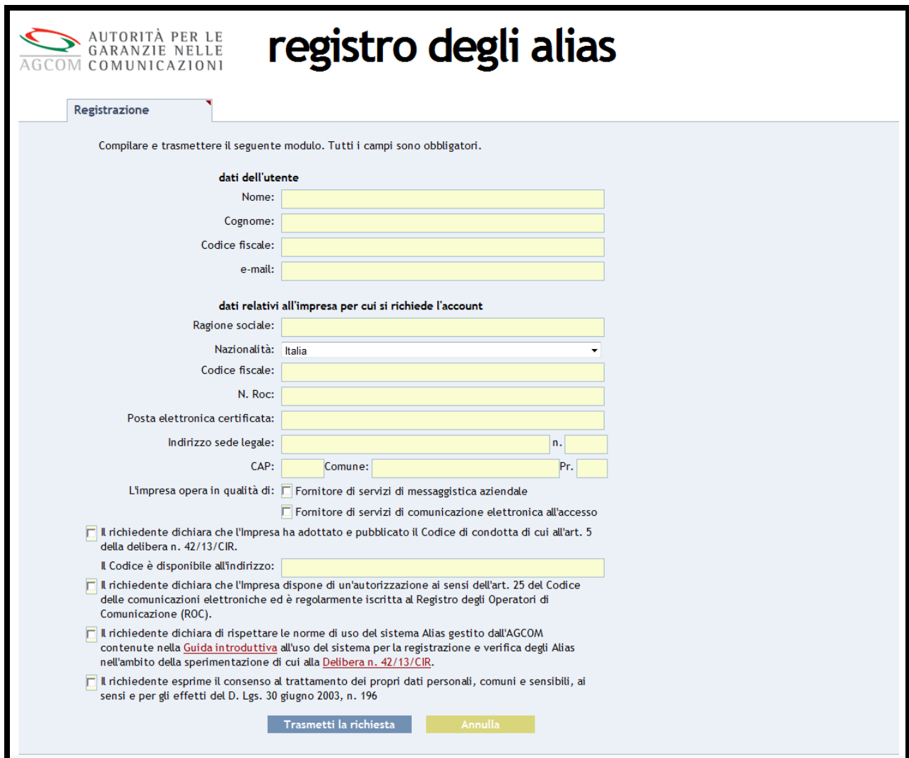
Figura 2 – pagina di registrazione.

Completato l'inserimento dei dati richiesti occorre premere sul pulsante "Trasmetti la richiesta".